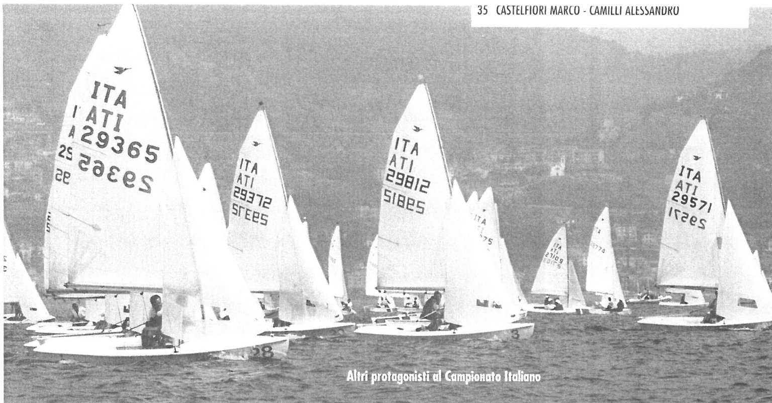
Altri protagonisti al Campionato Italiano